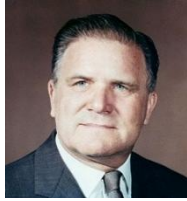
Edwin P. Hubble 1889-1953

"ଏହା ହୋଇପାରେ କି ଏହି 'ପୃଥିବୀର ଗୁରୁତ୍ୱାକର୍ଷଣ' ପ୍ରଥମେ ସ୍ଥାନିତ ହୋଇଥିଲା ଏବଂ ପରେ ବ୍ରହ୍ମାଣ୍ଡ, କାରଣ ଏହି ଗୁରୁତ୍ୱାକର୍ଷଣ ଶକ୍ତି ବ୍ରହ୍ମାଣ୍ଡକୁ ଏକତ୍ରିତ କରିଥାଏ ଏବଂ ପୃଥିବୀ ହେଉଛି ବ୍ରହ୍ମାଣ୍ଡର ପ୍ରକୃତ କେନ୍ଦ୍ର?"