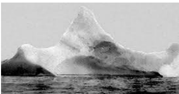
ଟାଇଟାନିକ୍ ଜାହାଜକୁ ବୁଡ଼ାଇ ଦେଇଥିବା ହିମବନ୍ଧ

ଯଦି ସେ ଏହା କହିପାରିଥାନ୍ତେ, ତେବେ ସେ ବରଫ ଖଣ୍ଡର ଚେତାବନୀ ଶୁଣିଥାନ୍ତେ, ଜାହାଜର ଗତିକୁ ଧୀର କରିଥାନ୍ତେ ଏବଂ ଅଧିକ ସତର୍କ ହୋଇଥାନ୍ତେ। କିନ୍ତୁ ଆମର ଗର୍ବରେ, ଆମେ ଅନ୍ୟମାନଙ୍କ ପରାମର୍ଶକୁ ଏକପାଖରେ